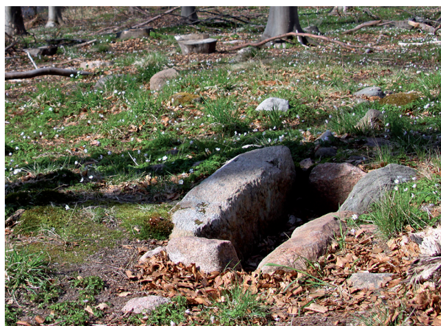
Langdysser ved foden af Hejrebakken

Der er et svagt spor efter en stenalderhulvej, som går fra den nedre dysse skråt op over bakken forbi den øvre dysse. Lidt længere fremme, hvor sti 53 krydser stien "Måløvvej", ses til venstre oppe på skråningen nogle dybe hulveje. De er yngre end stenalderhulvejen og har været brugt til at forcere højdedraget på vej fra Harevad til Lille Værløse.