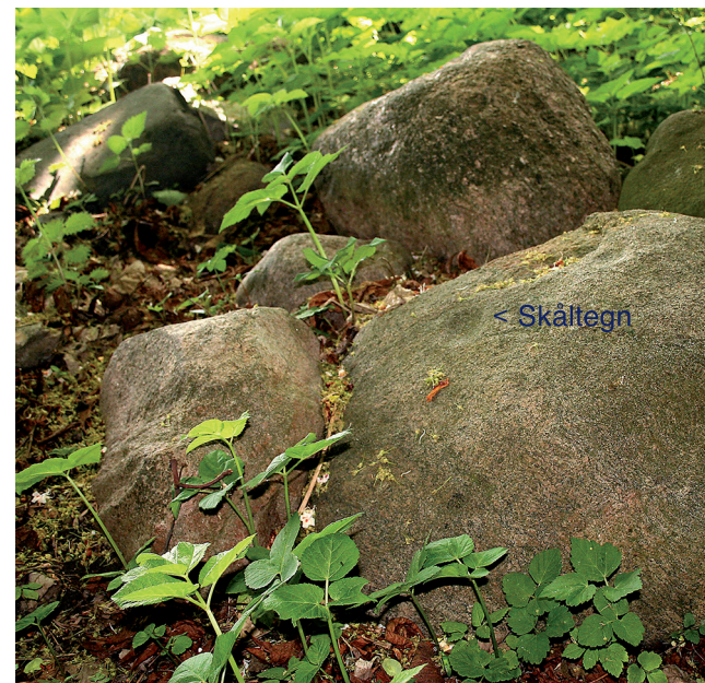
Sten med skåltegn

smal passage op ad bakken. Næsten på toppen af bakken findes dyssen, hvor kun to af dyssekammerets fire sten er tilbage. Dyssekammeret, hvor også dækstenen mangler, er det eneste, der er tilbage af en lille langdysse. Oprindeligt har dyssekammeret med dæksten været dækket af en flad jordhøj omkranset af store randsten. Forskellige tiders stenhuggere har fjernet sten fra dyssen, og jordhøjen er gennem de mere end fem tusinde år, dyssen har ligget i Jonstrup Vang, blevet udjævnet af vejrliget.