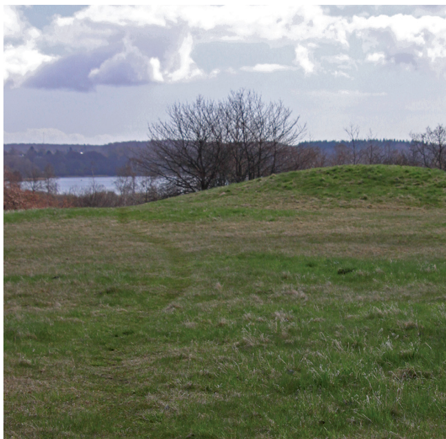
Eningshøj: Gravhøj fra sen stenalder - Søndersø anes i baggrunden

Yderligere oplysninger kan læses på Furesø Kommunes tavle, som står ved krydset med de to stier, der afgrænser området ved Eningshøj.