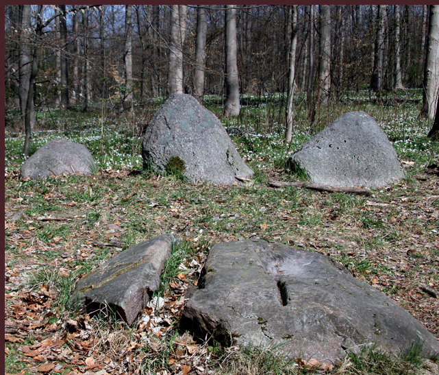
Dyssen Tingstedet i Jonstrup Vang

På kortet er med violet stiplede signatur markeret stier, som giver mulighed for kortere ture. Stierne er cykelegnede.